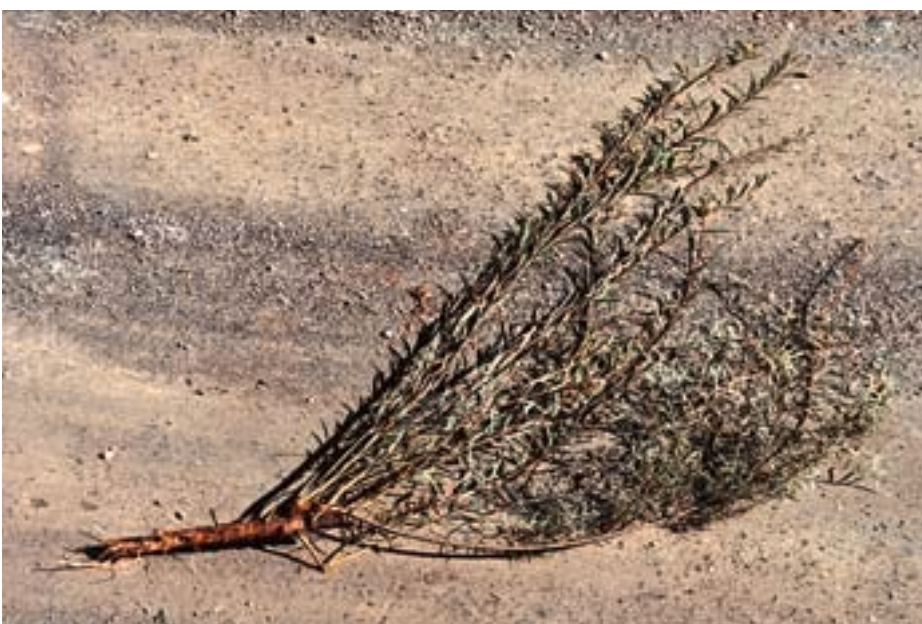
Abb. 6. Düngereinfluss: Dreijährige Purpurweide ( Salix purpurea ) aus einer gedüngten Verbauungs- fläche mit gut ausgebildetem Spross und schlecht entwickeltem Wurzelwerk.

Als Alternative spielt die Zugabe von Mikroorganismen, insbesondere von Mykorrhizapilzen, eine entscheidende Rolle. Einerseits sind sie Baumeister von Bodenaggregaten und mitverantwort- lich für eine stabile Bodenmatrix und Porenstruktur. Andererseits überneh- men sie wichtige Funktionen in der Pflanzenernährung und im Nährstoff- kreislauf.