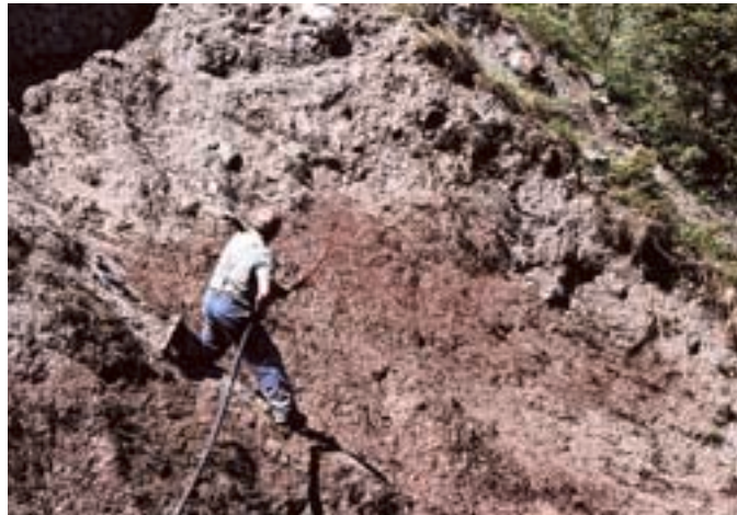
Abb. 2. Hydrosaat: Aufspritzen eines Samengemisches kombiniert mit flüssigem Dünger und Klebstoff in schwer zugänglichem Gelände und mit einer Strohecke kombinierte Hydrosaat kurz nach der Fertigstellung auf einer Skipiste in der alpinen Zone.

Alle technischen Verbaumassnahmen zur Stabilisierung (Hangfuss-Sicherung,