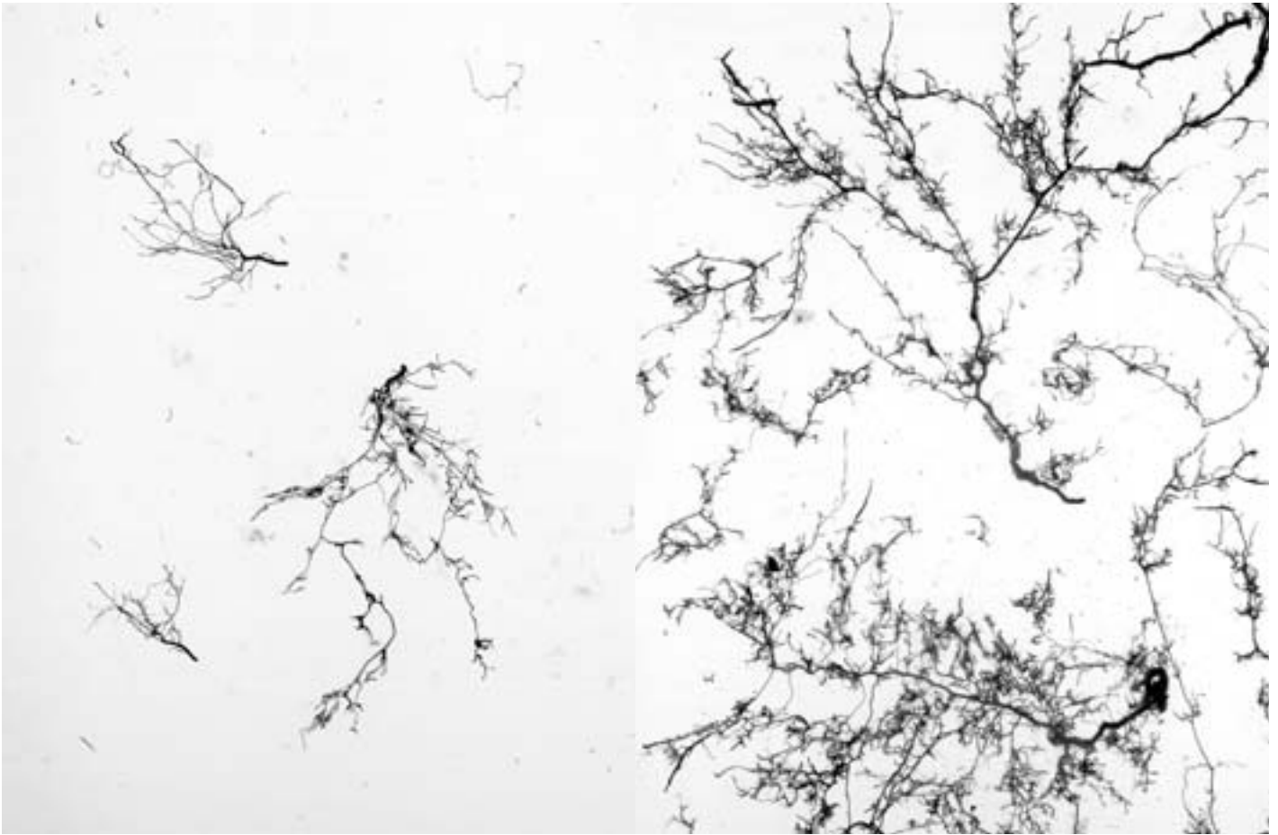
Abb. 7. Mykorrhiza: Wurzelwerk von je drei fünf Monate alten Weisslerlen ( Alnus incana ). Links ohne Mykorrhizapilz; rechts inokuliert mit Paxillus

rubicundulus , einem Pilzpartner, der auch in der Natur mit Weisslerlen Ektomykorrhizien bildet.