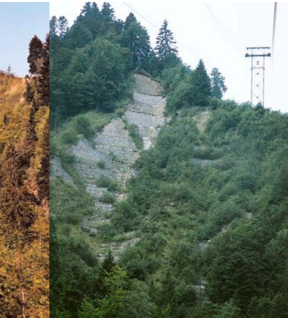
Abb. 8. Entwicklung: Der Weg von der kahlen Rutschungsfläche über die Pioniervegetation bis zur eigentlichen stabilen Zielvegetation dauert Jahre bis Jahrzehnte. Zwischenstadien nach 10 und 15 Jahren.