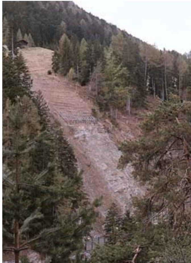
Abb. 4. Lebensfeindlicher Boden: Stark erodierter und ausgewaschener Boden im unteren noch nicht verbauten Teil eines steilen Rutschhanges.

Die neuen Bodenoberflächen weisen im Vergleich zum Ursprungsmaterial häufig eine höhere Dichte auf, da sie zuvor unter der Last der darüber liegenden Schichten lagen. Diese Situation ist im Zusammenhang mit Wurzelbildung und Pflanzenwachstum ein entscheidender Nachteil und verzögert die Etablierung einer Vegetationsdecke beträchtlich (BÖLL und GERBER 1986). Zudem wird die Bodendurchlüftung und somit die Zersetzung organischer Substanz gehemmt, was sich negativ auf die Nährstoffbilanz auswirkt. Neben Durchwurzelbarkeit und Bodenbelüftung sind weitere für das Pflanzenwachstum wichtige Faktoren, wie Wasser- und Nährstoffangebot, entscheidend von der Körnung des Bodens abhängig. Vermehrter oberflächlicher Wasserabfluss führt zu Materialabtransport mit einem massiven Verlust der Sand- und Siltanteile sowie der Tonfraktion. Die Folgen sind geringere Aggregatstabilität und damit verbunden, beträchtlich reduzierte Rückhaltekapazität für Porenwasser und Nährstoffe (GRAF und GERBER 1997).