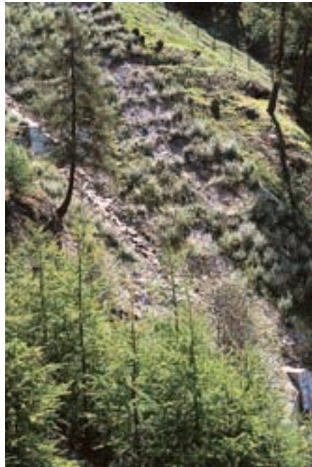
Abb. 5. Ingenieurbio- logie und Waldbau: Stabili- sierung von Seiteneinhängen eines Wildbach- gerinnes im Bereich der Waldgrenze mit Hilfe von Buschlagen (Weidensteckhölzer) und Fichten/Lärchen Aufforstungen (Vordergrund).

Mit Hilfe ausgedehnter Wurzelsyste- me vermögen Pflanzen dem Boden durch Transpiration beträchtliche Men- gen an Wasser zu entziehen und üben so einen regulierenden Einfluss auf den Bodenwasserhaushalt aus. Eine Son-